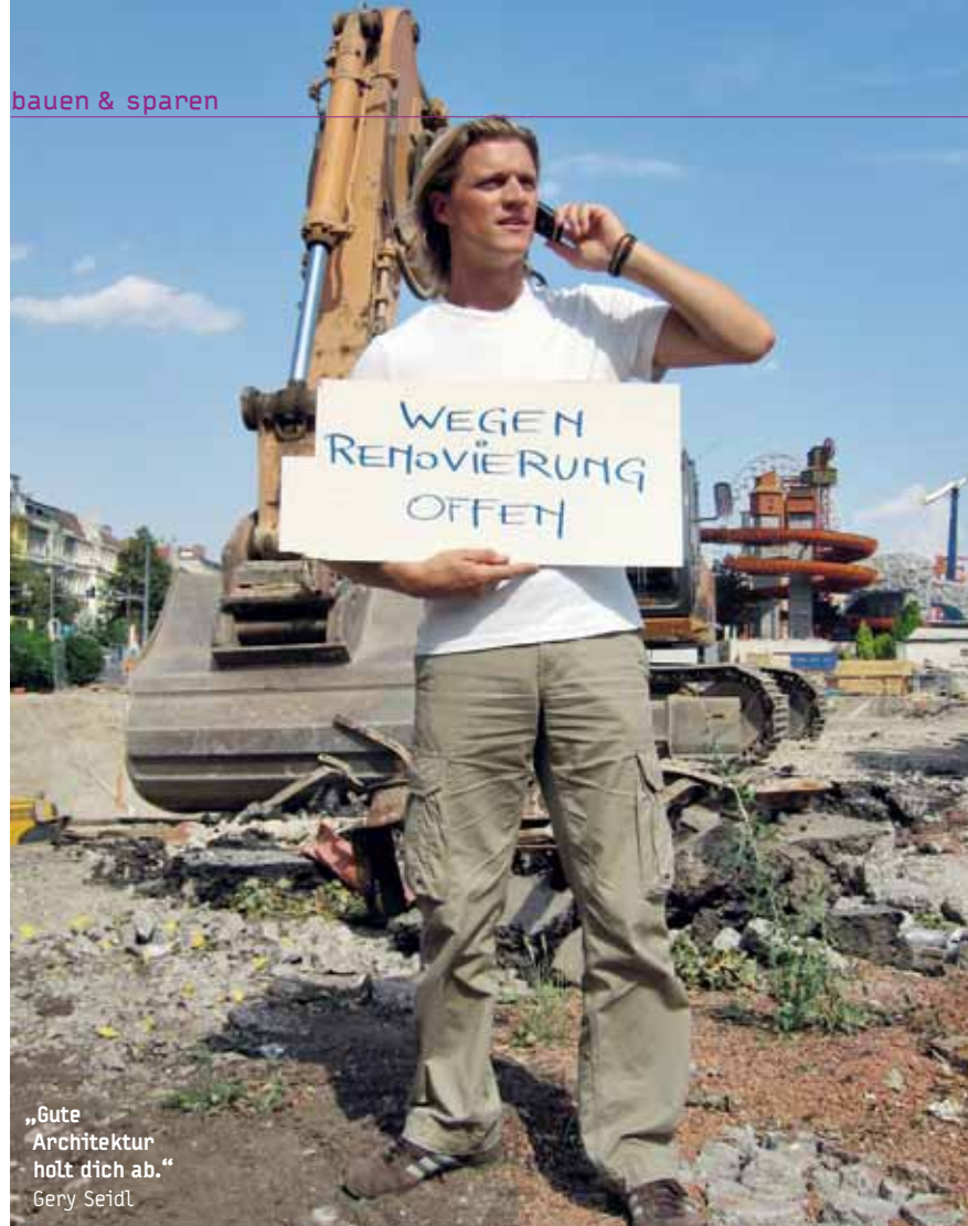
„Gute Architektur holt dich ab.“ Gery Seidl